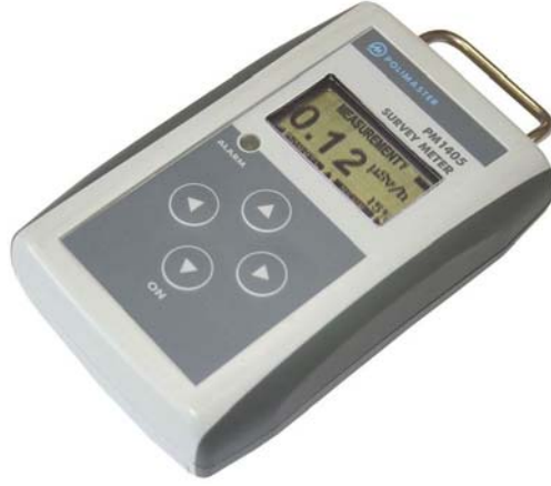
Şekil 1. Polimaster Survey Meter PM1405 detektörü